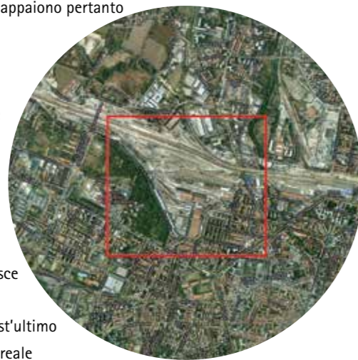
Identificazione dell'ex scalo ferroviario Ravone a Bologna